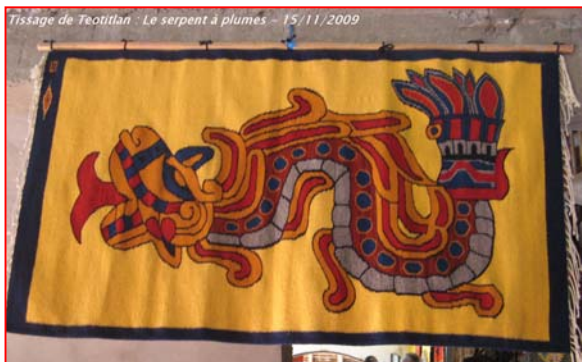
Tissage de Teotitlan - Le serpent à plumes - 15/11/2009

Dimanche, le bus nous conduit au site archéologique de Monte Alban, distant de seulement 8 km d'Oaxaca mais situé à plus de 2000 m. Le centre cérémoniel a été édifié par les Zapotèques à partir du II e siècle avant J.C. puis, après 950, les Mixtèques ont transformé l'endroit en une grande nécropole. Palais, temples et stade se répartissent autour d'une vaste place sur laquelle se trouve un observatoire. Le stade était destiné au jeu de pelote, après lequel les vainqueurs avaient l'honneur d'être décapités pour rejoindre les dieux !