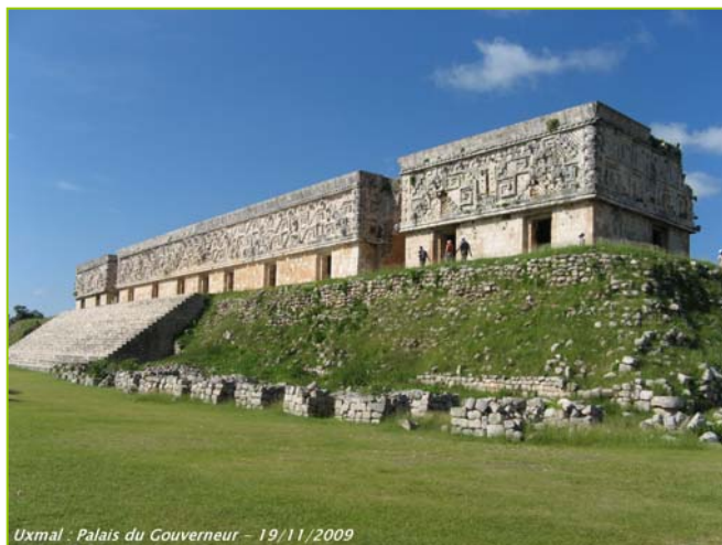
Uxmal - Palais du Gouverneur - 19/11/2009

Le Palais du Gouverneur est parfaitement conservé, les 2/3 supérieurs de sa façade montrent une décoration exubérante (motifs géométriques, masques de Chaac, grecques, serpents, escargots de la vie...). Le bâtiment des Tortues, très sobre, doit son nom à la frise de tortues qui court en haut de ses murs alors que le bâtiment de la Justice est orné de colonnes. Sur les hauts murs du Jeu de Pelote, une copie des anneaux de pierre a été remise en place