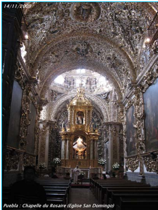
Puebla - Chapelle du Rosaire (Eglise San Domingo)

La journée du samedi 14 commence par une nouvelle promenade dans Puebla, maisons baroques, casa del Alfenique, place des Artistes... Les églises sont innombrables. En dépit d'une façade sobre, Santo Domingo révèle un intérieur d'une extraordinaire richesse ; la chapelle du Rosaire, en particulier, est un véritable joyau croulant sous l'or et les ornements.