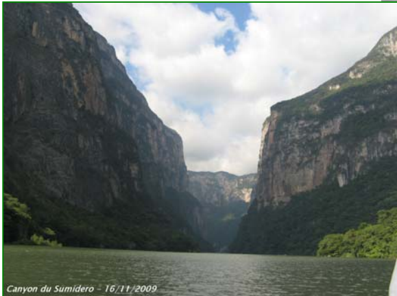
Canyon du Sumidero - 16/11/2009