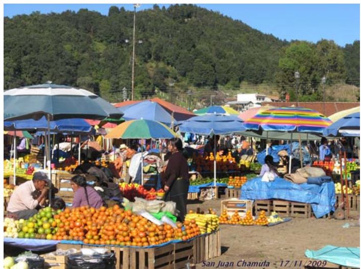
San Juan Chamula - 17/11/2009

Après un bon repas et une nuit réparatrice, il est déjà temps de quitter San Cristobal. Nous montons à San Juan Chamula, l'un des plus grands villages mayas du Chiapas, dont les