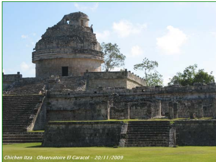
Chichen Itza : Observatoire El Caracol - 20/11/2009

La pyramide de Kukulcan séduit par ses proportions parfaites, rien n'a été laissé au hasard, les nombres de paliers, façades et marches se réfèrent à la cosmologie. Dans la zone maya puuc, nous voyons la