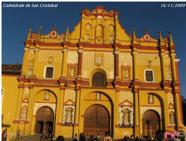
Cathédrale de San Cristobal

Notre hôtel, localisé en pleine ville, est vraiment plein de charme avec son patio, ses colonnes et ses arcades colorées ; nous n'y passerons malheureusement qu'une seule nuit ! San Cristobal, prototype de la ville coloniale, a beaucoup de cachet.